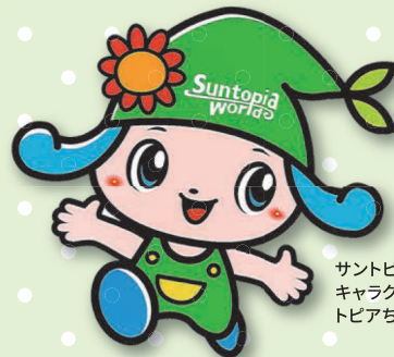
サントピアワールド キャラクター トピアちゃん